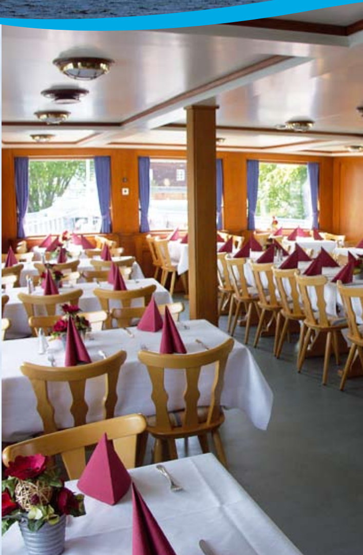
Der rustikale Hauptdecksalon.

MS BAYERN – ein historischer Dampfer mit Charakter und Flair.