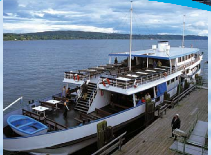
Schöne Aussicht vom geräumigen Sonnendeck.