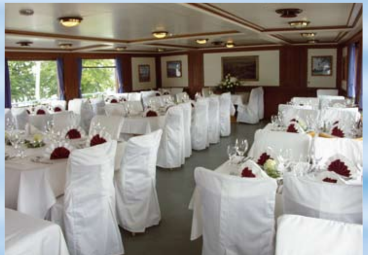
Auch Ihre besonderen Wünsche erfüllen wir gerne.